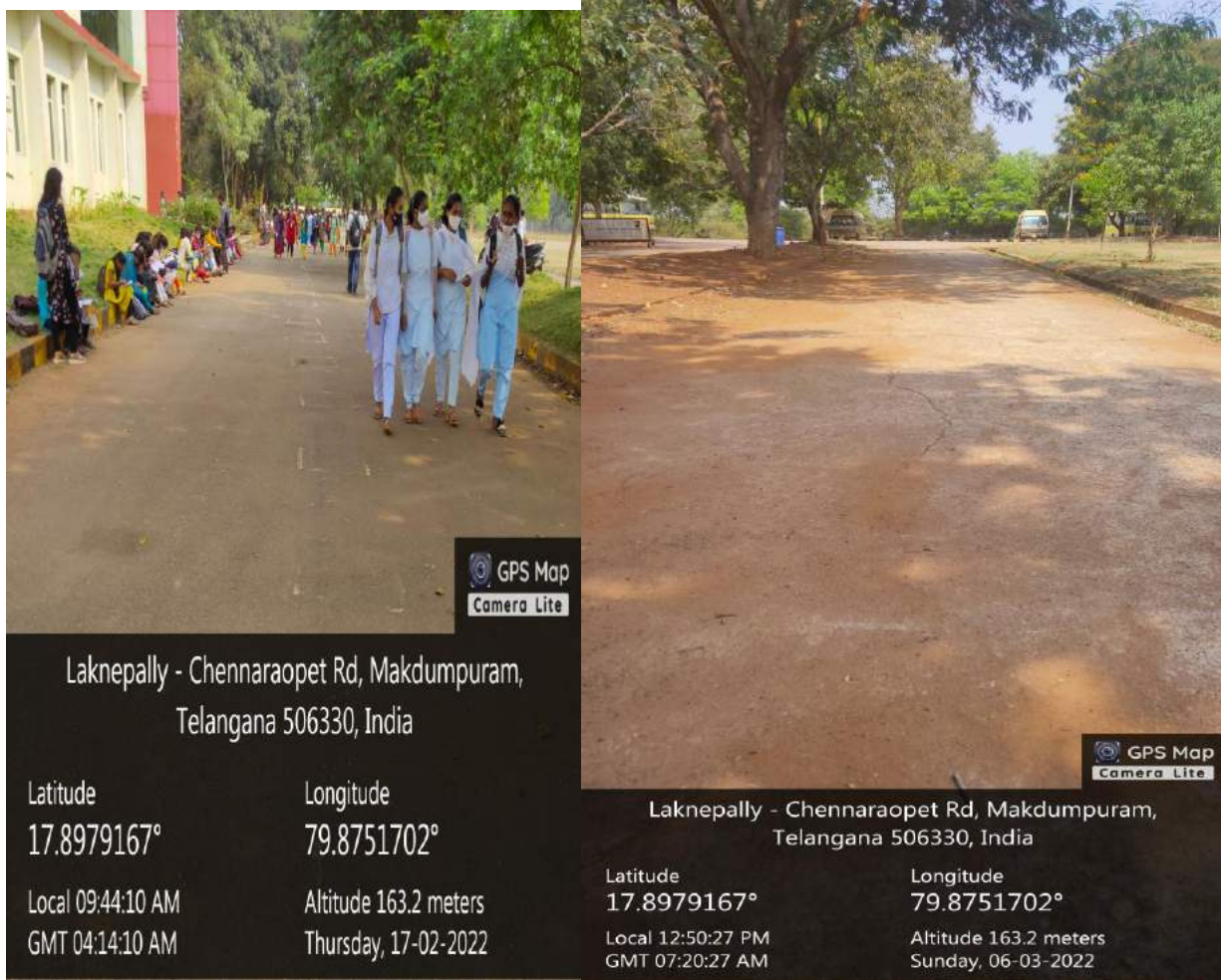
Pedestrian Friendly pathways

Mostly the vehicle movements are avoided in the campus, the foot path roads are used by pedestrians which are available in the campus at all required places. Separate roads and routes are there for vehicles to move and park in particular area. This reflects the safe way of transport system in campus to avoid any accidents that may occur.