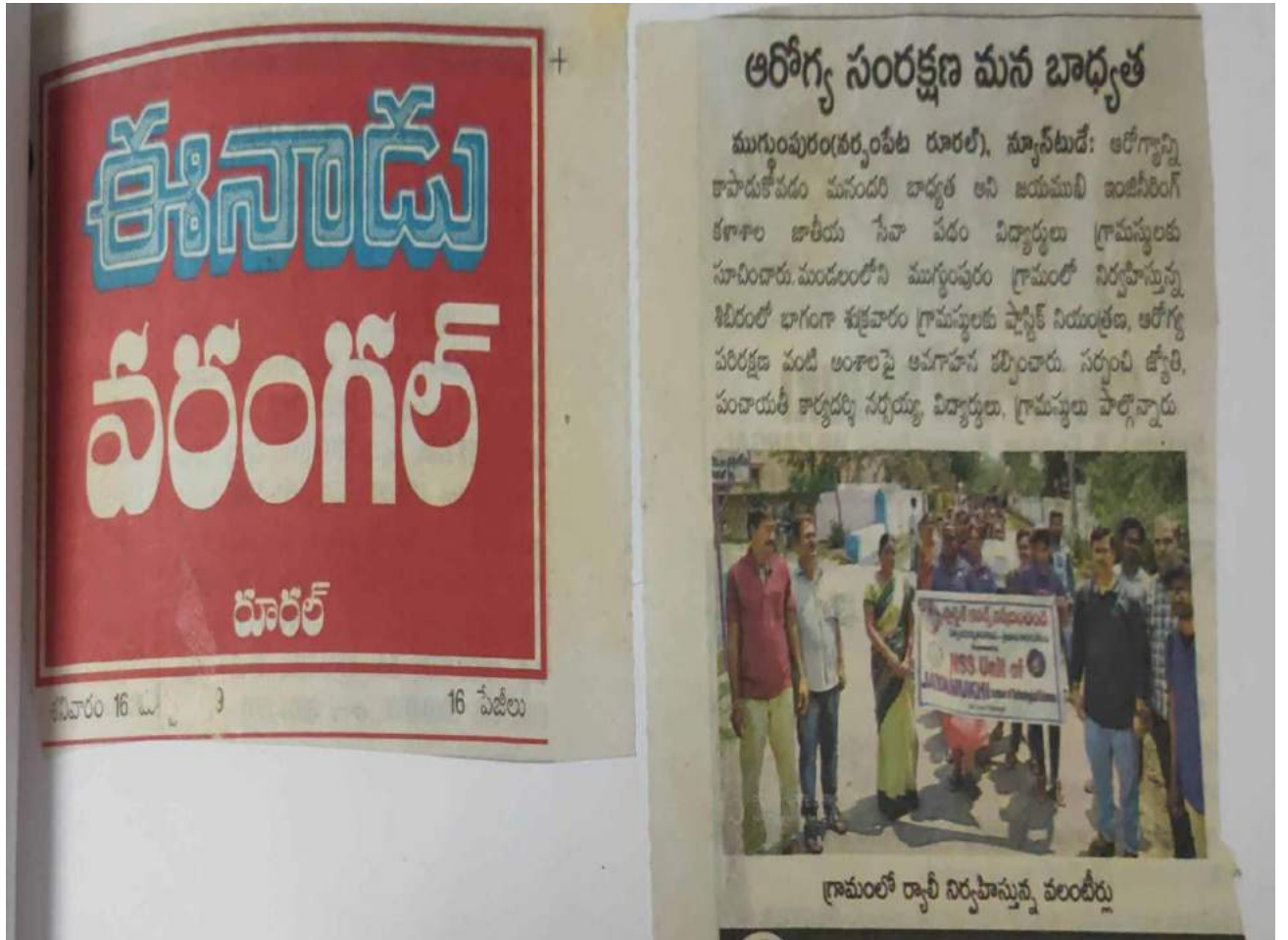
Program on Ban of use of plastic at nearby villages

The college is striving towards becoming a plastic free campus. in this regard the principal and the staff are encouraging students not to use plastic in their daily activities. Information regarding reducing the paper in administration is intimated to all the departmental in charges and to the other staff members. This information is also circulated in the whatsapp groups and through E-mails thus limiting the need to use paper.