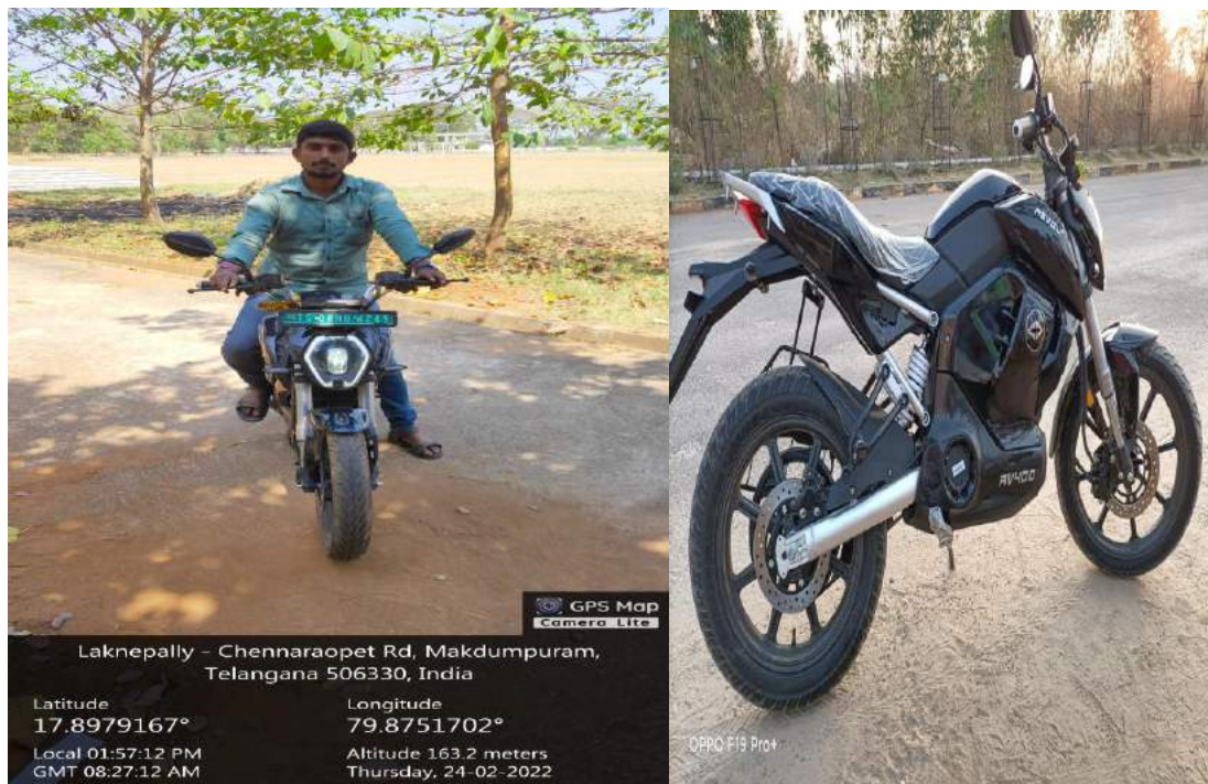
Battery powered vehicles usage in college campus

In JITS, staff and students use the bicycles to move around the campus. Staff and students who are near by the college are encouraged to come by bicycle.