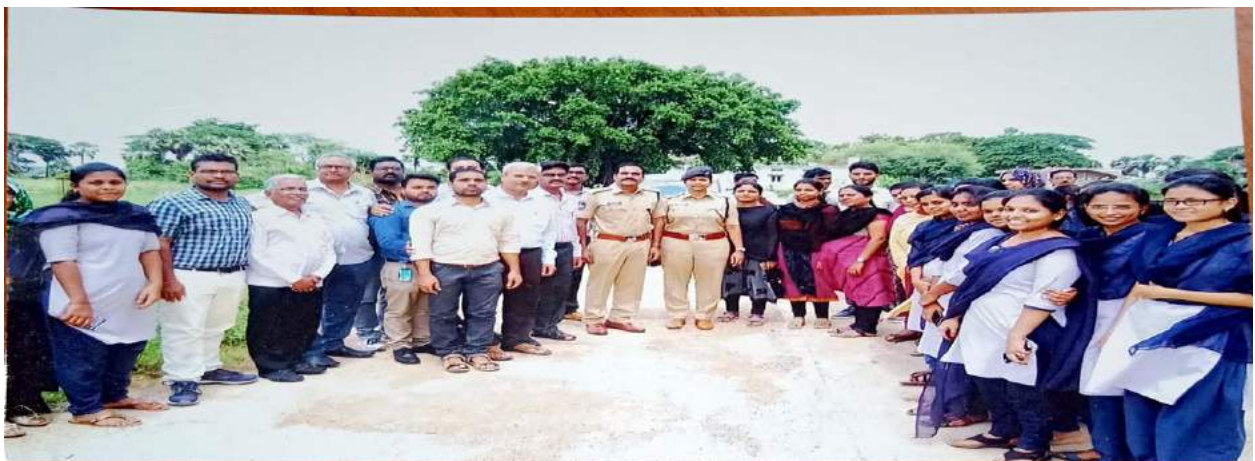
Haritha Haram Program